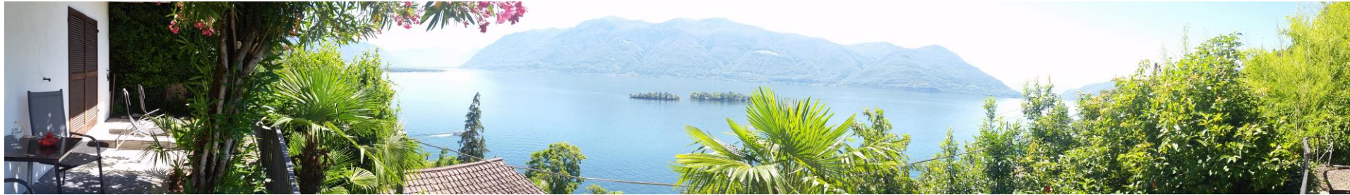
Rundblick von der Casa Viola mit Fish-Eye-Objektiv