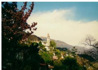
Ronco sopra Ascona - 353 m ü.M.