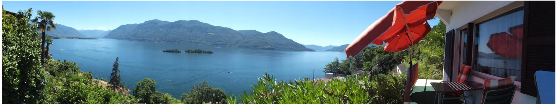
Rundblick von der Casa Viola Ascona