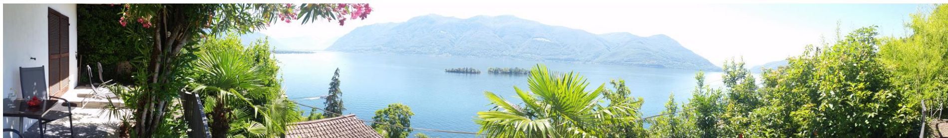
Rundblick von der Casa Viola mit Fisheyeobjektiv